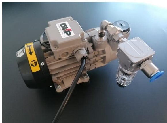
Abb. 1.: Vakuumpumpe HP-VZ1200.

Zusätzlich werden ein Rückschlagventil (a) und ein Abscheider inkl. Filter (e) mitgeliefert. Achten Sie darauf, den Abscheider mit Pfeilrichtung zur Vakuumpumpe anzuschließen.