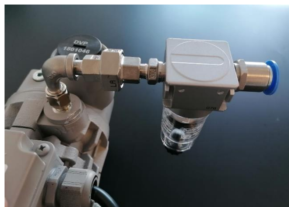
... und montiert an der Vakuumpumpe.

Vor Inbetriebnahme muss zunächst das mitgelieferte Vakuumöl eingefüllt werden. Beachten Sie hierzu die Hinweise der Bedienungs- und Wartungsanleitung